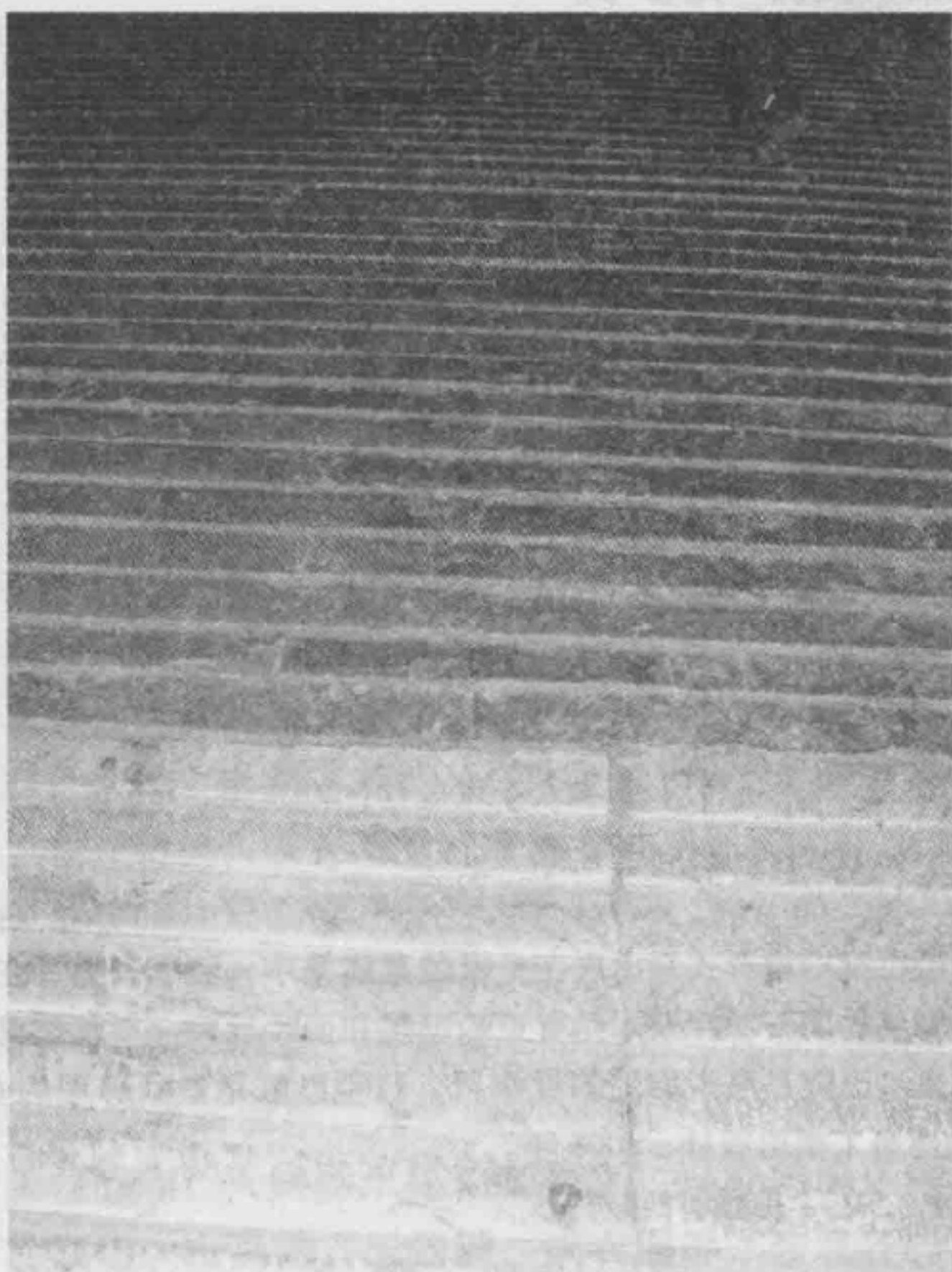
地宮中老磚質（上部）與新石質（下部）礮礮

其實，古代中國人眼中的建築所具有的意義比現在要複雜得多，它們的特徵也絕不僅僅局限於建築本身的功能，其他如等級制度、建築形態、建築位置等要素都是中國古代看待建築的重要角度。我們作為現代人，要想瞭解古代建築，最正確的方法應該是從歷史本身所呈現出來的角度去分析歷史，讓歷史自己說話。也就是說，祇有先瞭解歷史、理解歷史，纔能真正瞭解古代建築的內涵和古代建築名稱的含義。