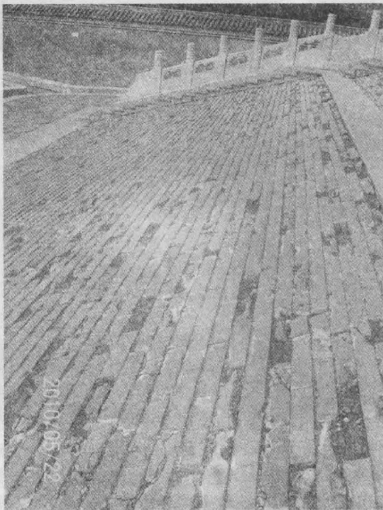
方城明樓外磚質礶礶