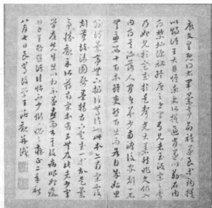
(作者單位：國家圖書館古籍館古籍善本特藏典閱組)